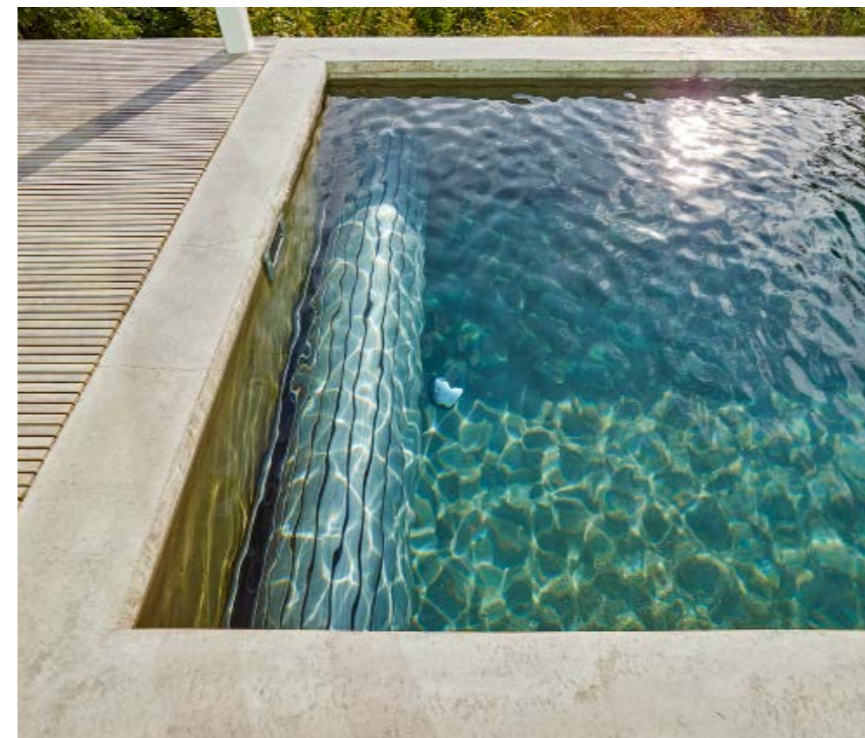
Der Solarrollladen, hier in aufgerolltem Zustand unter Wasser sichtbar, trägt zur Beheizung des Beckens bei und schützt zudem vor Verunreinigungen.

Der Swimmingpool hat mehr Freizeitspaß in den Alltag der Familie gebracht und zugleich die Außenanlagen des Hauses aufgewertet. Genutzt wird er täglich, und das bei einer Schwimmsaison von Ostern bis in den Spätherbst hinein: ein Stück Lebensqualität mit Super-Aussicht. ⇒⇒